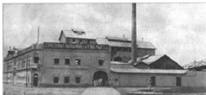
Cervecerías Barranquilla y Bolívar S.A.; hoy, Cervecería Aguila.