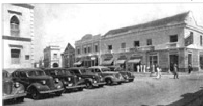
Plaza de San Nicolás, desde el Puerto Bolívar.