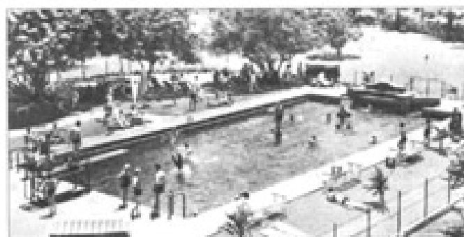
Piscina del Hotel del Prado.