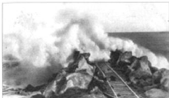
Expedones de Bocas de Cerros.

Tu bandera de luz sube y expande el sentir del triunfal Libertador.