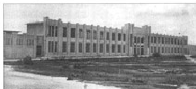
Escuela de Artes y Oficios.