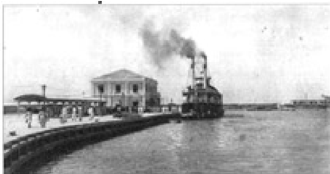
Intendencia Florial del Puerto de Barranquilla.