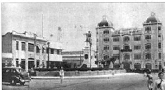
Estatua de Bolívar, al fondo Edificio Palma.