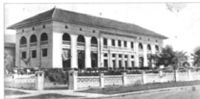
Edificio de la Exposición de Productos Nacionales, hoy, Escuela de Bellas Artes.